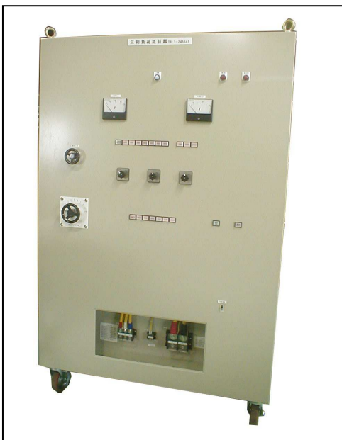
1200mm (W) × 1900mm (H) × 1050mm (D) 質量約 600kg