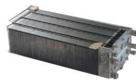
燃料電池スタック