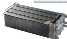
燃料電池スタック

750kWの太陽光発電システムの太陽電池 開放電圧 470V 直流電圧での試験の場合 470V \times 1.5 \text{倍} = 705V