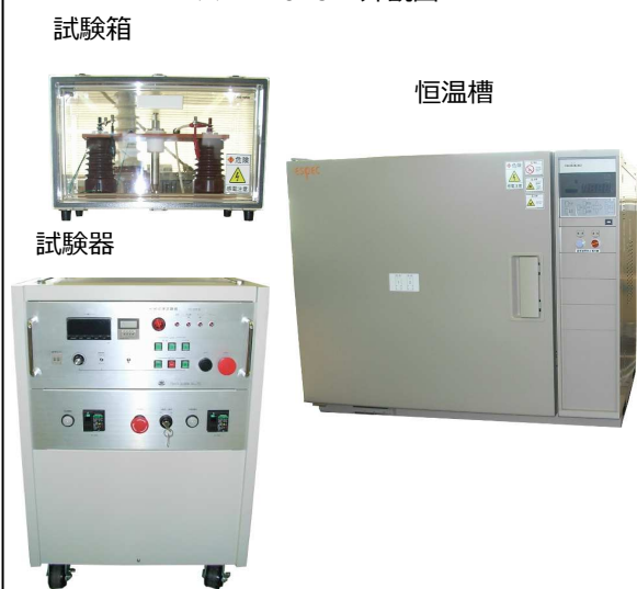
※1 EB0181 外観図