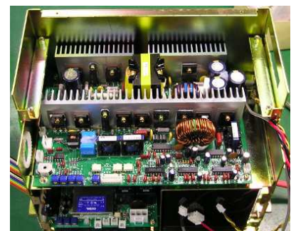
15kV 直流高圧電源 内部写真